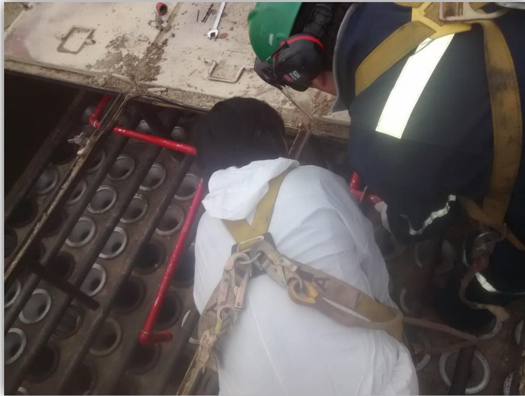
Instalación RCI Filtros.