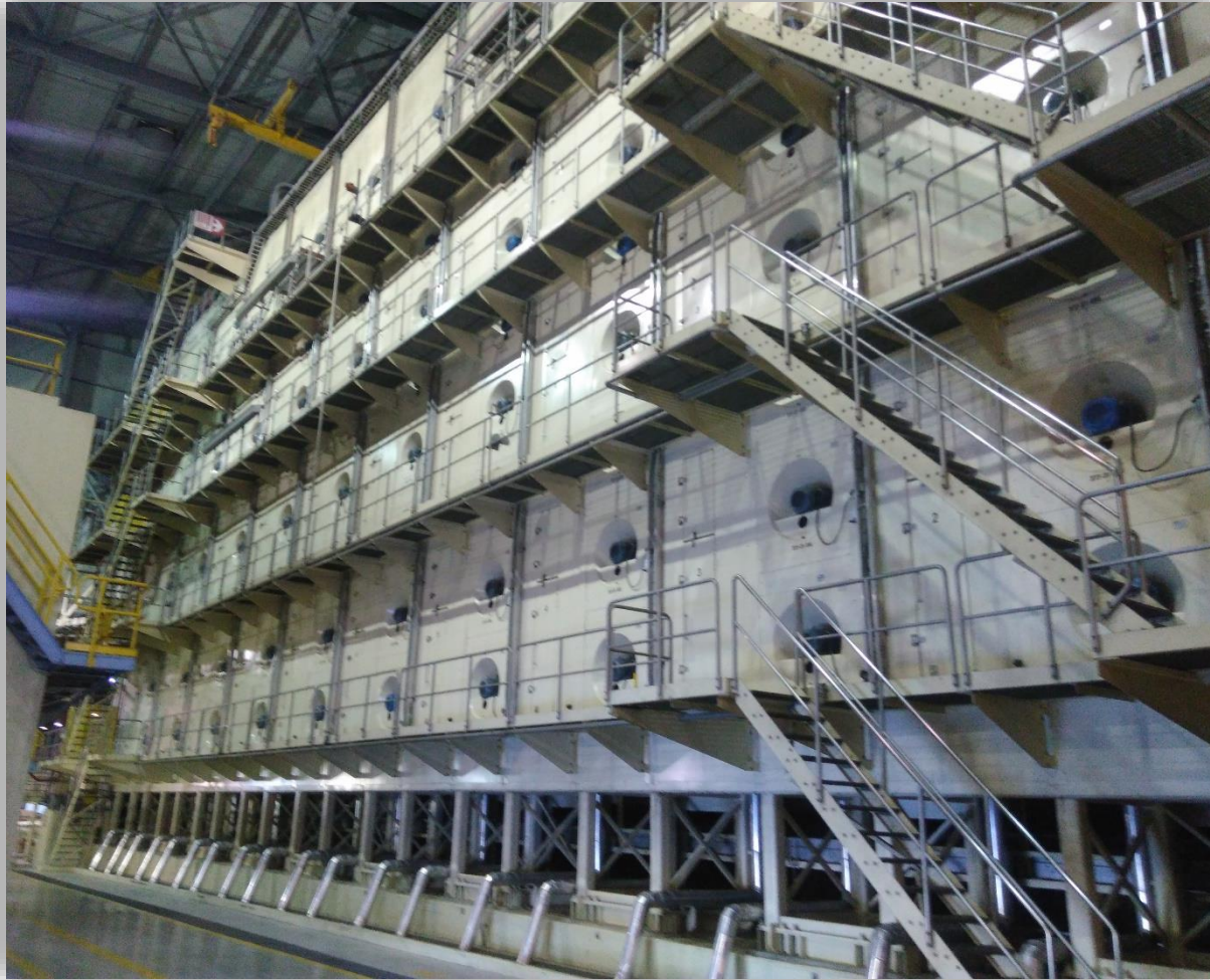
Cambio de módulos de secadoras.